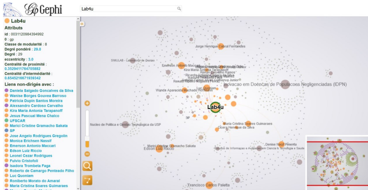
Figure 1 : exemple de réseau/ cartographie réalisé à partir du logiciel Gephi (recherche académique au Brésil)